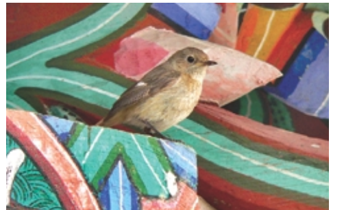
안국사 딱새 알컷.