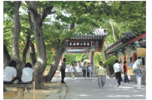
일주문과 맞붙어있는 사하촌.

들에게 사진을 찍어주면서 삼남매를 가르치고 먹고 살았다. 옛날에는 수덕사 입구에 우람한 빛나무들이 꽃을 피워 관광객들을 끌어 모아 주었다. 도로를 넓히는 과정에서 오래된 나무들이 하나둘 없어져 그 풍광이 사라져 아쉽다고 했다. 개인용 카메라가 많지 않던 시절이라, 사진을 찍어달라는 사람들이 많아서 사진사는 웬만한 월급쟁이 보다 수입이 좋았다. 관광객들 추억을 박제해 주며 생긴 일화들을 떠올리더니 그는 옛날로 돌아갔다. “사진을 찍고 현상하여 우편으로 보내는데 한 달이 걸렸지요. 오랜 친구들과 여행을 와서 사진을 찍었는데, 사진이 배달되지 않아 사기 당한 줄 알았다며 염서를 보내온 사람도 있었어요. 기다림이 필요한 시절이었지요.” 관광객 발길이 끊이지 않아 장사가 잘 되어 사하촌