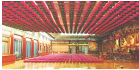
연등 자동 승강장치 작동