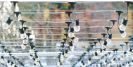
외부에 시공된 전선케이블

찬덕연등에서는 KS케이블 을 사용하여 가장 안전하게 전문 기술인에 의해 직접 감독 시공 합니다.