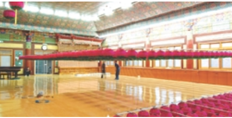
지등 승강 장치(등부 조정 작업)