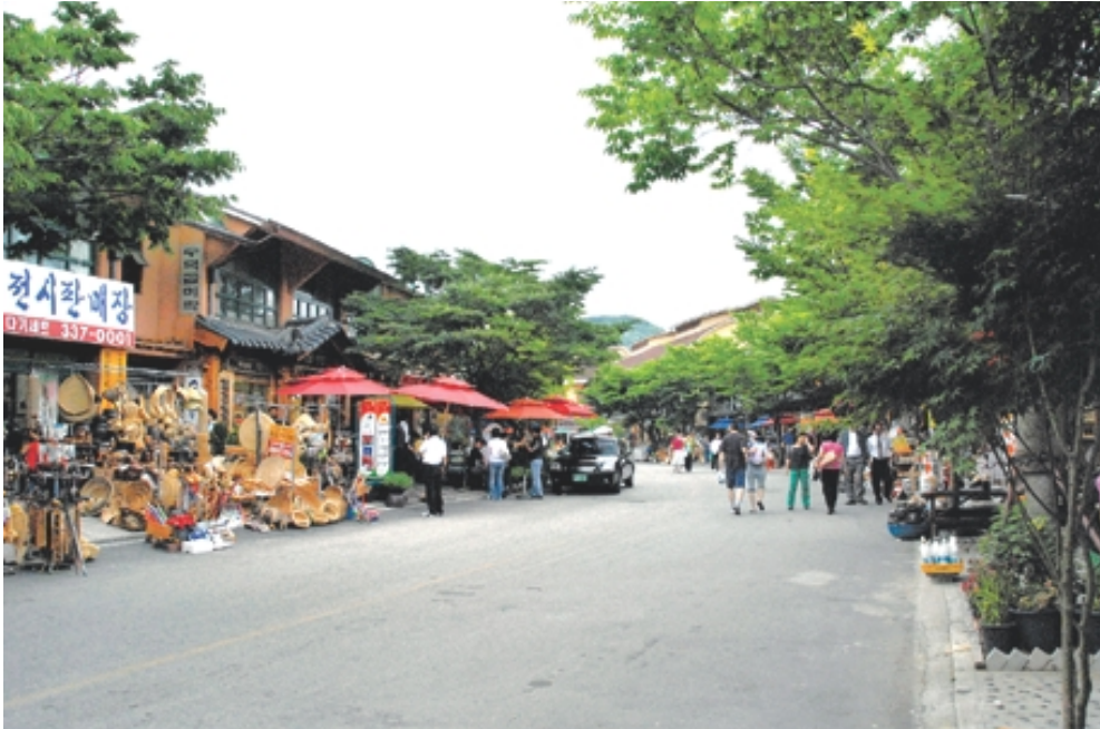
수덕사 사하촌에는 54개의 상가를 기반으로 400여 주민이 살고 있다.

수덕사 대웅전은 봉정사 극락전, 부석사 무량수전에 이어 우리나라에서 3번째로 오래된 건축물이다. 오랜 세월 불자들의 마음 도량이 되었던 탓에 대웅전 기둥의 터진 자국들은 혈관처럼 도드라져 있다. 법화 삼매에 빠지는 듯한 느낌이다. 대웅전은 석가모니 부처님을 모신 전각으로 석가모니를 위대한 영웅으로 일컫는 데서 유래했다. 주존 불인 석가모니를 중심으로 좌우에 문수보살과 보현보살을 봉안하였다. 정면 3칸, 측면 4칸의 겹처마 맞배지붕이며 정갈하게 만든 장대석으로 높은 기단을