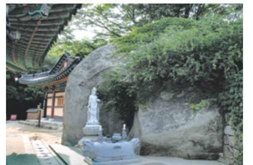
대웅전 뒷편의 관음보살상.