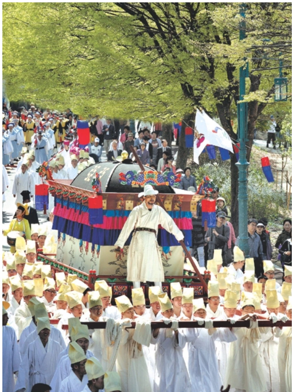
단종의 국장 행렬(사진 위쪽) 단종을 죽인마에 태워 승천을 기원하는 모습.

글=이우상(소설가/asdfsang@hanmail.net)