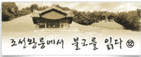
6대 단종 장릉

단종 1441년~1457년, 17세 출 재위 3년 2개월 1452.5(12세)~1455.5(14세)