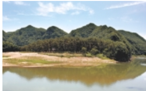
단종 유배지 청령포

천만리 머나먼 길에 고운 님 여의옵고 내 마음 돌 데 없어 냇가에 앉았더니 저 물도 내 안 갈아서 울어 밤길 예눅다