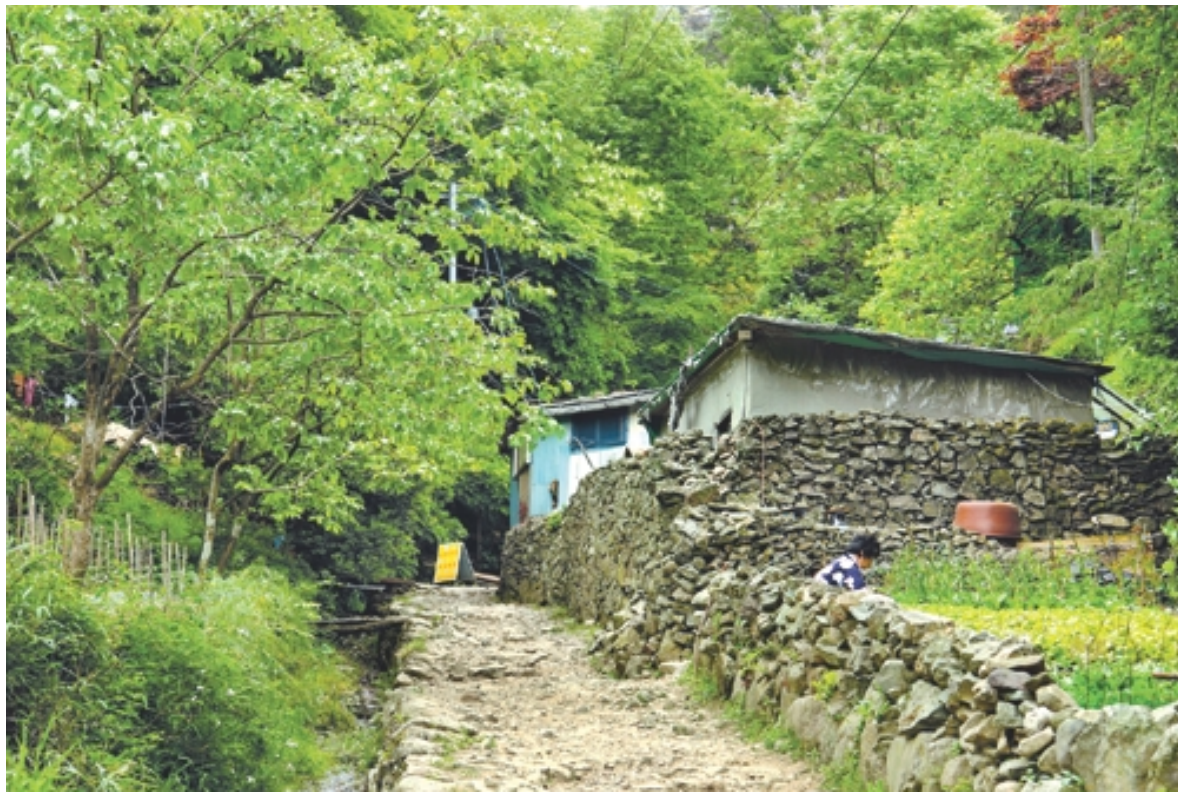
일주문 안에 있는 속가들.

광주 사람들의 삶의 기쁨 하나는, 무등산 봉우리를 어디서나 볼 수 있다는 데 있을 것이다. 나는 무등산을 볼 때마다 어머니를 떠올린다. 자신은 더 큰 아픔을 안고 있으면서 자식들의 작은 상처에 눈물 보이는 어머니. 자신은 제대로 걸지도 못하면서 괜찮다 괜찮다는 말만 하시는 어머니. 누구든 무등을 보면 모시고, 뒤를 린 자신을 추스를 수 있을 것이다.