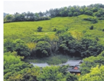
차밭에 둘러 싸인 증심사.