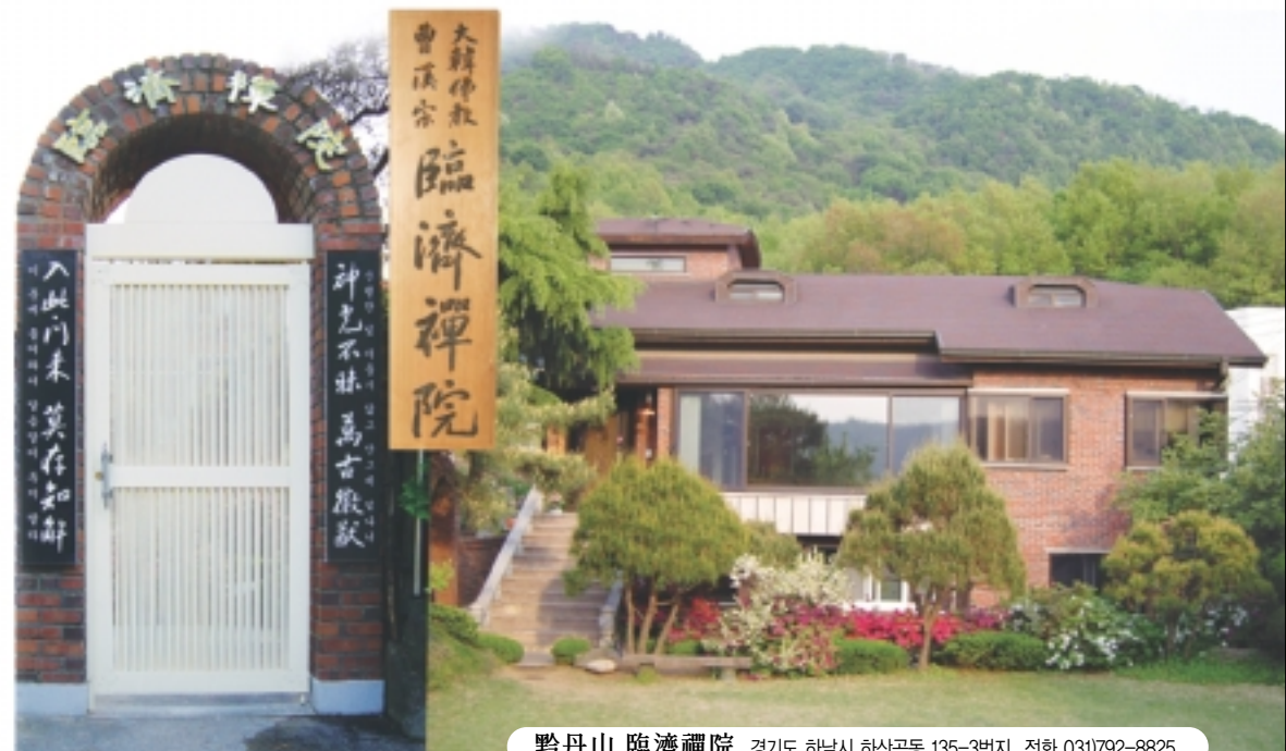
黔丹山 臨濟禪院 경기도 하남시 하산로동 135-3번지 전화 031)792-6825

큰 기틀로 크게 쓰니 하늘과 땅을 토해 내고, 서강(西江)의 물을 다 들이켜니 비로자나 정상의 진법신(眞法身)이요 거리의 술집에서 쌍쌍으로 취한 아이들이라