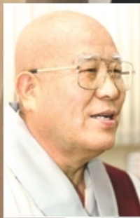
현성 스님은 중앙승가대학교 2회 총장 역임, 도선사 주지 역임, 사회복지법인 혜명복지원 이사장 역임, 국무총리청소년보호위원을 역임하였다. 지금은 대한불교청소년연합회 총재이며, 한국청소년학회 이사장이며, 학교법인 동국대학교 이사로 활동하고 있다. 1996년 최우수 청소년단체로 선정돼 대통령상을 수상하였고, 2003년 제 2회 동국청우상을 수상했다.

“ 청소년은 불교의 기둥이요 희망 일방적 지식을 전달하기 보다는 큰 그릇 만드는 인성교육이 중요 ”