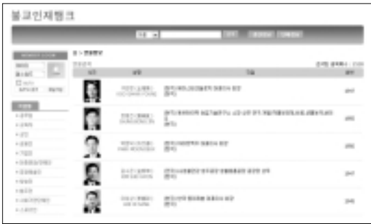
현재 구축 중인 '불교정보뱅크' 일부본

조계종 중앙신도회(회장 김의정)가 올 하반기 불교 관련 뉴스와 인물 정보, 카페, 블로그 등을 한 눈에 볼 수 있는 불교종합포털사이트를 오픈할 예정이다. 특히 포털사이트에는 불자 인물정보가 제공될 계획이라 눈길을 끈다.