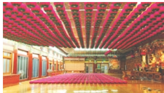
연등 자동 승강장치 작동