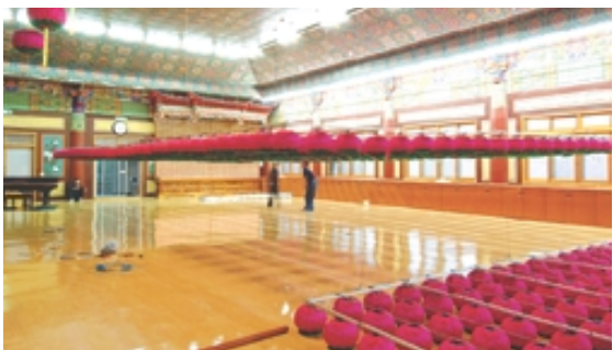
자동 승강 장치(등표 조정 작업)

전선(케이블) - 찬덕연등에서 시공한 사찰 (대한불교천태종 광수사 법당)