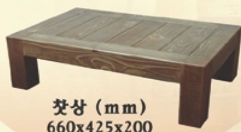
찾상 (mm) 660x425x200

※ 겨울에 수축하고 여름에 팽창하는 살아 숨쉬는 소나무 좌탁입니다. (무늬목을 입힌 좌탁은 수축 팽창을 하지 않습니다.)