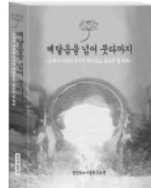
536쪽 / 15,000원

- 영산불교사상연구소에서 동서고금 종교 명상 철학 서적 약 1천 여 권을 읽고 '21세기 붓다의 메시지'를 열독하면서 법법(法法)에서 초신성으로 새내려간 불후의 명작(名作)