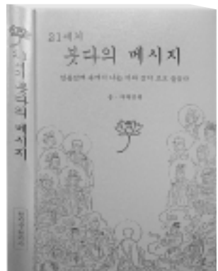
314쪽 / 15,000원

- 재대한현 크스님께서 30여 년간의 치열한 연불수행을 통해서 얻은 붓다의 경지를 21세기 최고의 초신성으로 새내려간 미증유의 성서(聖書) - 21세기 전세계 동서고금을 초월하여 우주역사에 길이 남을 불교 수행 및 사상의 기념비적 금자역이며 전대미문의 성서(聖書) 영문판 출간예정