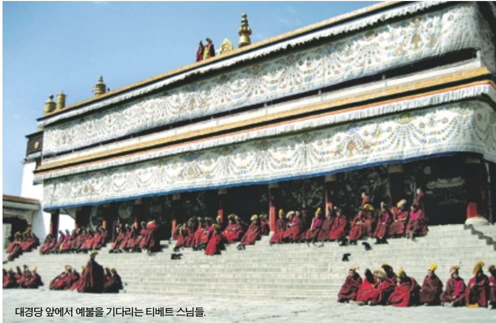
대경당 앞에서 예불을 기다리는 티베트 스님들.