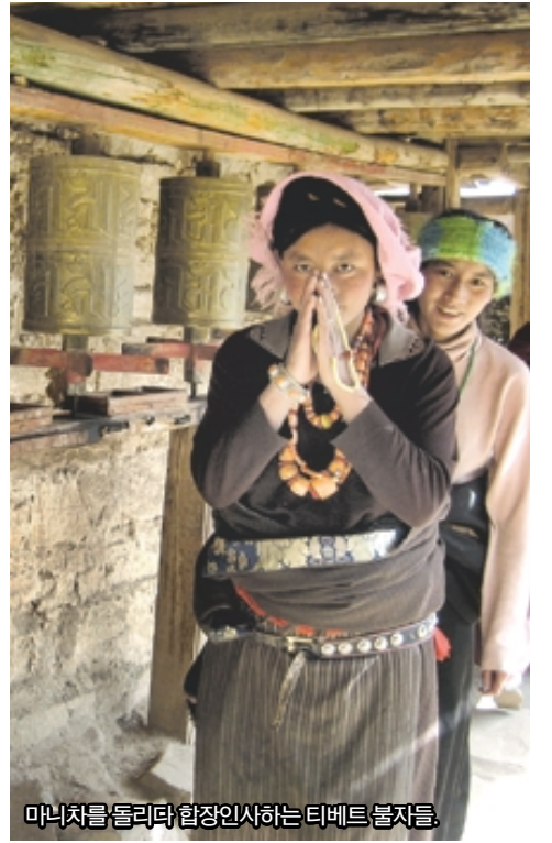
마니차를 돌리다 합장인사하는 티베트 불자들.