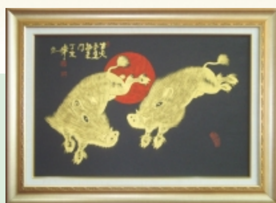
황금 돼지 1호

※ 작품을 구입하시는 모든 분자님께 지갑소지용 황금돼지 카드를 1장씩 드립니다.