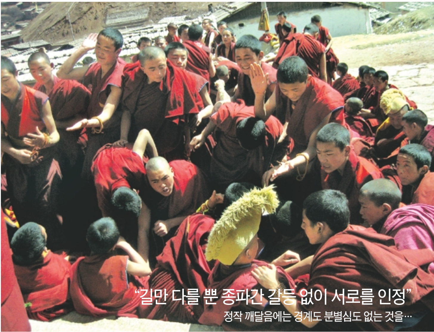
“길만 다를 뿐 종파간 갈등 없이 서로를 인정” 정작 깨달음에는 경계도 분별심도 없는 것을...