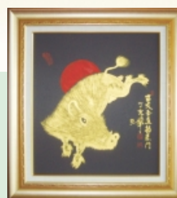
황금 돼지 2호