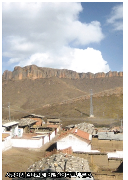
사람이와 같다고 해 이빨산이라고 부른다.