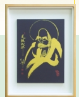
황금 달마도 2호