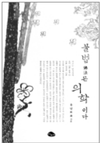
신국판 | 319쪽 | 값10,000원