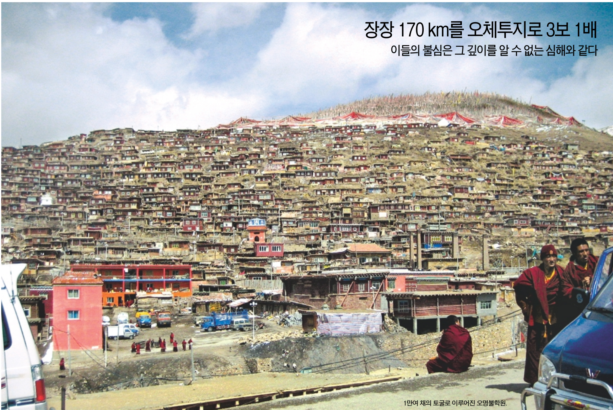
장장 170 km를 오체투지로 3보 1배 이들의 불심은 그 깊이를 알 수 없는 심해와 같다

밤이 찾아오자 추위가 시작됐다. 추양취마 스님은 연불 삼매경에 빠져 추위를 잊고 연불에 여념이 없다. 문득 나의 수행이 한없이 부족함을 느끼게 된다. 바쁜