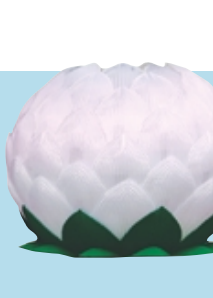
공 단 등