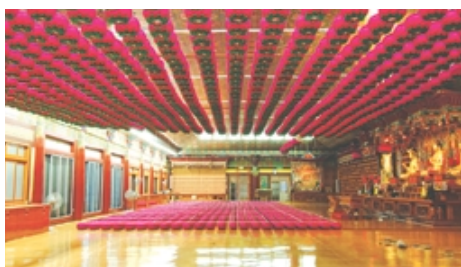
연등 자동 승강장치 작동