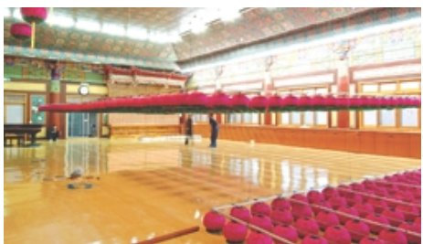
자동 승강 장치(등표 조정 작업)

전선(케이블) - 찬덕연등에서 시공한 사찰 (대한불교천태종 광수사 법당)