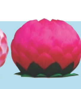
공 단 등