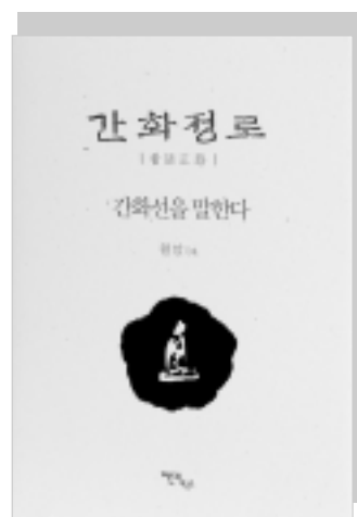
월암(月庵)스님 / 양정본-512P 18,000원

미래문명의 대안으로 떠오른 선행, 그 선의 정수이며 최고 수행법인 간화선의 역사와 사상, 수행을 내용으로 하는 지침서로 간화선에 대한 올바른 이론과 실상을 지향하는 수행자의 삶이 선수행의 올바른 길임을 제시해 준다.