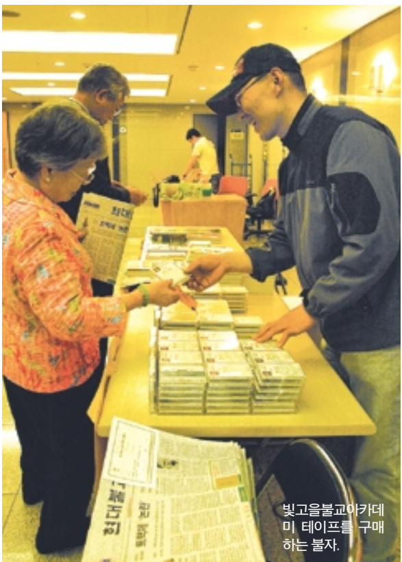
빛고을불교아카데미 티셔츠를 구매하는 불자.

그때 응답 스님이 등불을 비추주었습니다. 덕산 스님이 신발을 신으려고 하니 응답 스님이 훅 불어서 등불을 꺼버렸습니다. 더 안 보이죠. 그 참에 깨달았습니다. 신발을 찾으려고 하다 불을 꺼줄 때 덕산 스님이 완전히 깨달아버립니다. 그래서 다음날 금강경 소초를 마당 가운데 놓고 불질러버립니다. 그동안 외우는 데만, 해석하는 데만 전념했던 것입니다. 임제 스님과 쌍벽을 이루던 덕산