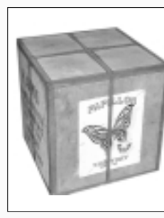
수출용 차 상자.

정보의 추진과 박람회를 통한 선진화동 덕분이다. 질이 떨어지는 제품은 정부에서 직접 단속하여 품질 개선시켰다. 뿐만 아니라 다른 개발을 위해 차 기술자들을 육성하기 시작했다.