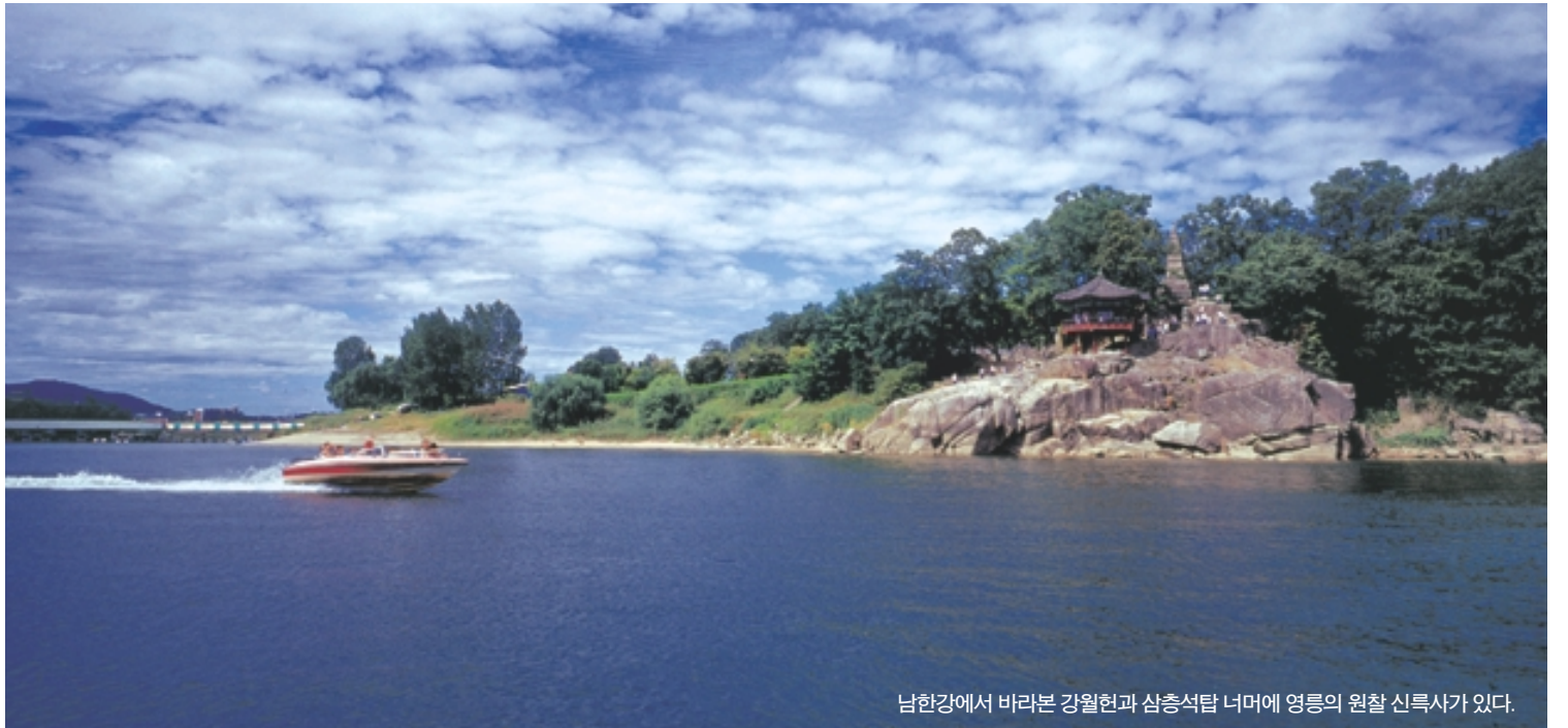
남한강에서 바라본 강월현과 삼층석탑 너머에 영릉의 원찰 신록사가 있다.

<조선왕조실록>은 불교에 대해서 참으로 인색하고 용렬하기까지 하다. 척불의 기록은 세세한 것까지