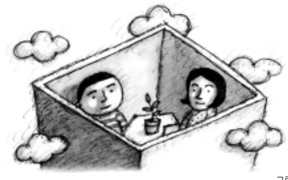
그림 : 문병성

이렇게 경전에 나타난 상담 장면은 현대의 상담 장면과 많이 다르다. 당시의 내담자들은 우리들과 달리 삶이 좀 더 답박했기 때문은 아닐까? 오늘날의 내담자들이 상담실을 찾으면서 비밀 유지를 최우선 조건으로 꼽는 것을 보면 나름대로 추량해 본다. ■ 불교상담개발원 사무총장