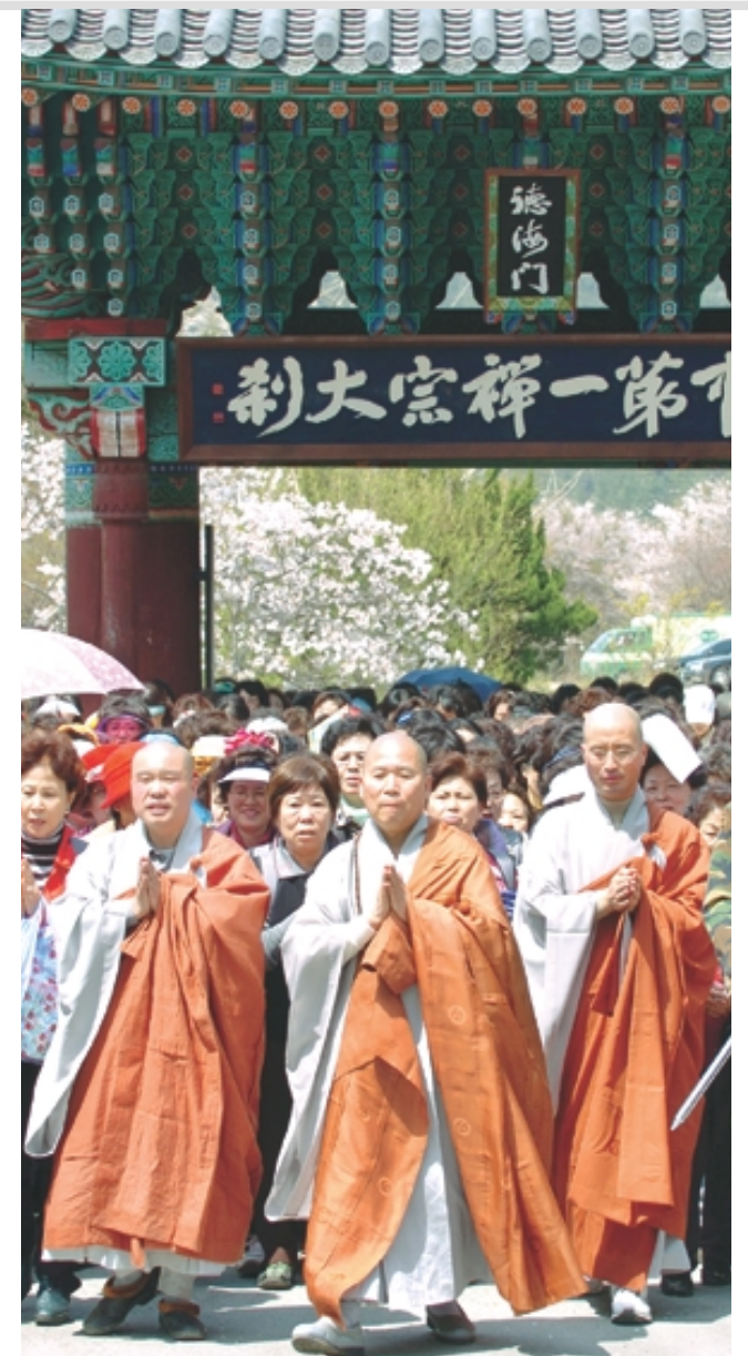
▼ 대웅전 중창불사가 한창인 도갑사 경내에서 기도심회에 빠져있는 3000여 108산사순례기도회원들.