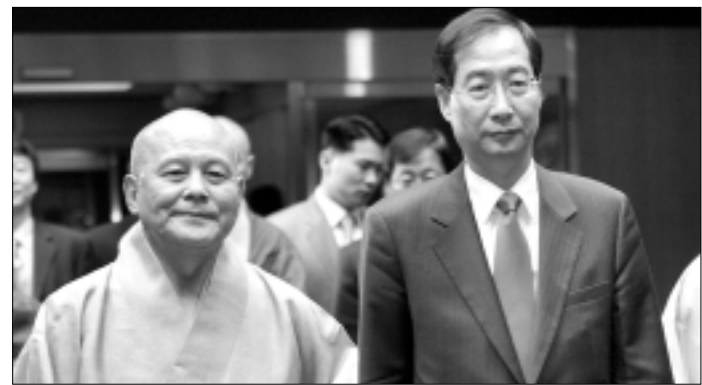
조계종 총무원장 지관 스님이 한덕수 총리를 맞이하고 있다.

한덕수 국무총리가 신임 인사차 4월 12일 조계종 총무원장 지관 스님을 예방했다. 현직 총리가 종단을 공식 방문한 것은 처음 있는 일이다. 이 자리에서 총무원장 지관 스님은 "국무총리에 취임한 것을 축하한