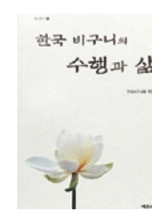
한국 비구니의 수행과 삶 김성우 지음 전국비구니회 역음 예문서원 | 1만8000원

이 책은 여성 불자들의 위상을 이런 수준에까지 끌어올리고자 노력했던 많은 비구니선사들의 행적을 밝히면서 한국 비구니승가의 역사와 수행양상의 전모를 밝히고 있다.