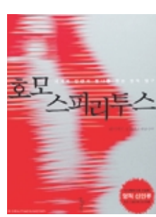
호모스피리투스 데이비드 R. 호킨스 지음 백영미 옮김 정선세계원 | 1만9500원

영적 교사인 데이비드 호킨스 박사가 이번에 출간한 <호모스피리투스>는 ‘의식혁명’, ‘나의 눈’에 이은 3부작 완결편이다. 호모스피리투스의 특성인 ‘내재와 초월을 넘어 신성의 빛으로 가득한 깨달음의 나, 무한한 나’에 이르는 영적 진리 문답을 담고 있다. 저자는 “깨달음이라는 궁극적 목표 아래 영적 진화를 촉진하는 것이 이 책의 목적”이라고 소개하고 있다.