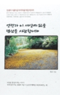
연젠가 이 세상에 없을 당신을 사랑합니다 월호 지음 마음의 숲 | 9500원

“불교에서는 아무것도 결정된 내가 없습니다. 현재 지금 이 자리에서 내가 하는 행동이 바로 나라의 존재를 결정짓는 것입니다. 그러므로 매 순간마다 치열하게 살아야 합니다. 그러기 위해선 살아있는 동안 열심히 부처님 가르침을 배우고 익히며 저버릴게 실천하고 선업을 쌓아야 합니다.” 월호 스님은 “이렇게만 산다면 그것이 바로 잘 사는 법이며 동시에 연젠가 찾아올 죽음을 잘 맞이할 수 있는 후회없는 법”이라고 조언한다.