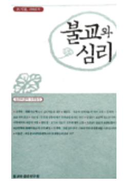
불교와 심리 권석만 외 8명 지음 불교와심리연구원 1만2000원

“불교와 심리치료의 출발점은 인간의 고통이다. 또한 모든 심리치 료자들이 비록 같은 훈련을 받았더라도 모두 같은 치료효과를 이끌어 내지 못하는 데 이것은 치료자의 능력과 인격이 중요한 요인임을 시사한다.” -최충동 한별정심병원장 “마음챙김 명상은 다양한 심리치유적 기능을 지니고 있다. 그것의 치료 효능은 명상수행을 통해서 뿐만 아니라 그것에 대한 내용을 유도하는 대화를 통해서도 가능하다.” -권석만 서울대 심리학과 교수 지난해 9월 서울불교대학원대학교에서 ‘불교와 심리’를 주제로 열린 심포지엄에서 발표된 내용들이다. 이 자리에는 불교학, 상담심리학, 요가학계의 중견학자와 정신과 의사 등 9명의 전문가가 참석해 열띤 토론과 발표를 했다. 이 내용들을 주최자인 ‘불교와심리연구원’이 학술지 성격의 단행본으로 만든 것이 <불교와 심리>다. 즉 이 책은 장간호 성격을 띠고 있다. 그래서인지 주목할 만한 세 주저자들이 가득하다. 가령 ‘불교는 고집멸도 사성제의 체계로 제시되며, 인간의 괴로움을 해결하기 위한 불교의 접근법은 심리치료와 유사하다’ ‘불교는 자기 치유를 통해 심리치료에 대한 부적응 상태를 극복할 수 있다’ 등등. 얼핏 책을 들춰보면 딱딱한 논문이라고 생각할지 모르지만 내용들을 차근차근 곱씹어보면 복잡해져 심신을 달래주기에 충분한 불교심리치료서다.