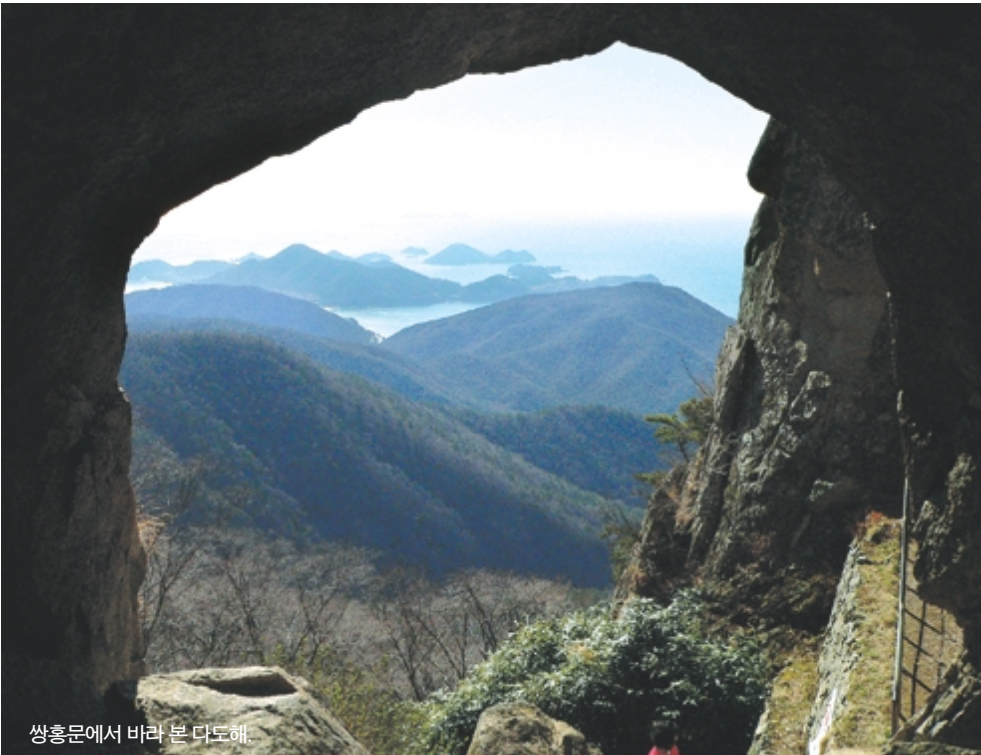
쌍홍문에서 바라 본 단도해

남해의 보리암을 비롯해 동해의 흥련암, 서해의 보문사 등 우리나라 3대 관음성지는 모두 바닷가에 위치해 있다. 이를 두고 조용현은 '능엄경 수행법의 한국적 수용'이라는 논문에서 바닷소리(海嘯音)를 관(觀)함으로써 아집을 털고 진리의 경지에 이르는 능엄선 수행을 위해 관음성지들이 파도소리가 들리는 바닷가에 자리하고 있다고 설명했다.