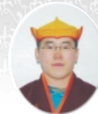
델브스님 (몽골 다시포럼)