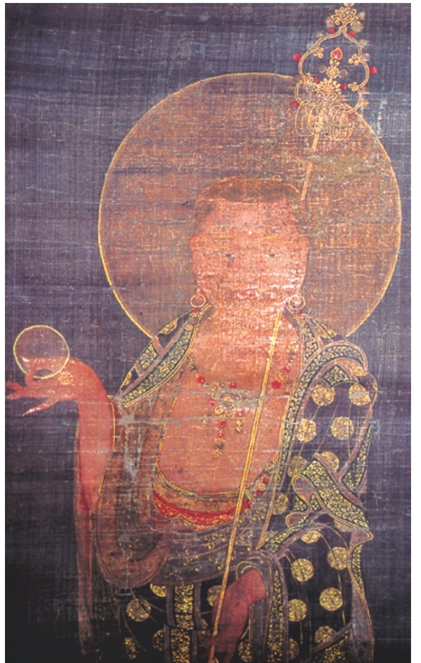
그림1: 메스미소니언 프리어갤러리 소장 '고려·지장보살도'

지장보살은 금석장과 여의주를 그 특징 지물로 가지고 있습니다. 석장은 부처님의 위신력을 대신하는 징표입니다. 마치 왕의 권한을 대신하는 양명(양)의 마패와도 같은 것이라고 할까요. 특히 그 누구도 열 수 없다는 지옥의 문을 열 수 있는 마법의 지팡이입니다. 지옥에 떨어진 어머니를 구하기 위해 부처님이 특별히 빌려준 석장을 가지고 아비 지옥으로 향하는 목련존자의 이야기(목련경에서도 확인할 수 있습니다). 또 여의주는 어두운 지옥에 광명을 비추어 밝히는 기