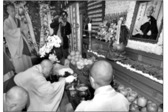
영결다비식이 3월 9일 정토사에서 진행됐다.