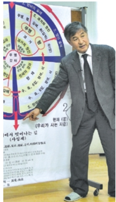
수행을 충분히 한 뒤에 집중력이 생기면 마음을 알아차리기가 쉽다.