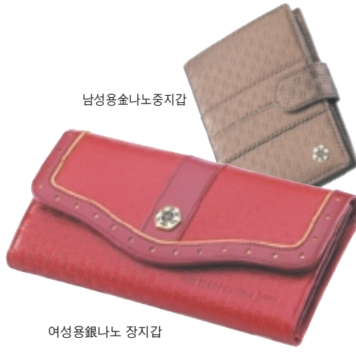
남성용송나노 증지갑 여성용銀나노 증지갑

600년만에 온 황금돼지 해 선물은 지갑! 새로하는 정해년 새지갑으로 평생부자!