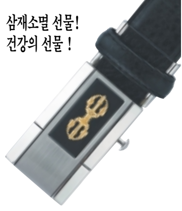
삼재소멸 선물! 건강의 선물!

삼고금강저벨트는 정해년 삼재가든 처사(남성)님들을 위해 항상 몸에 지니고 다닐 수 있게 제작된 벨트로 삼재소멸특별축원불공을 마치고 출시된 벨트입니다. 2007년부터 삼재가 시작되는 소띠, 뱀띠, 닭띠에 해당되는 처사(남성)님들께서는 삼재를 소멸하는 뜻깊은 선물이 될것입니다. 삼재라 하여 삼재가든 모든 사람이 안좋은 일만 생기는 것은 아닙니다. 삼재기간중에 삼재소멸비방을 잘하고 자중 자제하며 공덕을 쌓으면 삼재기간에도 크게 성공하는 사람도 많습니다. 삼재소멸금강저 건강자동벨트는 고급 천연소 가죽에 벨트메탈과 와 원적의선이 방출되는 실용신안 등록 벨트로 장과 간을 튼튼하게 하고 신진대사를 촉진시키는 기능성 고급벨트로 고급케이스에 담겨있어 선물로도 품격이 있습니다. 삼재가 끝나는데 말일날 삼재소멸 금강저벨트는 환중이에 써서 기도하시고 신속에 문의하시면 삼재는 모두 끝납니다. 전화로 신청하시면 택배로 불광사에서 보내드립니다. 가격:75,000원 문의전화:(02)741-4477 농협:032-12-193445 이상하