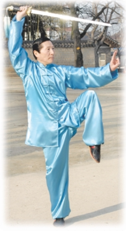
태극권 가운데 검술시범 장면.

19살 때, 아름다운 동네 누나를 짝사랑하면서 그 열병으로 도학에 관심을 갖게 됐다는 월담 거사. 그가 서양철학, 기독교를