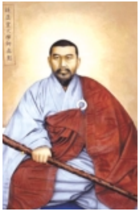
'평상심이 도' 한 차원 높여 분별심 없는 개천 삼강조

"그래? 참으로 너의 도력(道力)이 대단하다. 근 분별심 없는 개천 삼강조