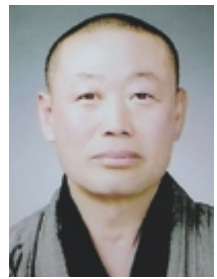
故 명허 스님

따라서 선가에서는 생과 사, 생사와 열반에 대해 분별하는 것을 망념으로 본다. 생사와 열반을 분별하여 생사는 싫어하면서 열반은 얻어야 할 절대적인 것으로 여긴다면 결코 생사를 극복하지 못한다는 것이다. 열반의 참뜻은 '지금 여기'에서 생사로부터의 해탈을 그대로 체득하려는 가르침이다. 결국 피안(彼岸)이 따로 있는 것이 아니라 차안(此岸)이 곧 피안이고, 세간이 바로