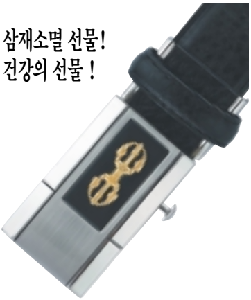
고급케이스에 있어 선물로 품격

삼고금강저벨트는 정해년 삼재가든 처사(남성)님들을 위해 향상품에지고 다닐수 있게 제작된 벨트로 삼재소멸특별축원불공을 마치고 출시된 벨트입니다. 2007년부터 삼재가 시작되는 소띠, 뱀띠, 닭띠에 해당되는 처사(남성)님들께서는 삼재를 소멸하는 뜻깊은 선물이 될것입니다. 삼재라 하여 삼재가든 모든 사람이 안좋은 일만 생기는 것은 아닙니다. 삼재기간중에 삼재소멸비방을 잘하고 자중 자제하며 공덕을 쌓으면 삼재기간에도 크게 성공하는 사람도 많습니니다. 삼재소멸금강저 건강자동차벨트는 고급 천연소가죽에 멜토에너지와 원외선외선 방출되는 실용신안 등롱 벨트로 장과 간을 튼튼하게 하고 신진대사를 촉진시키는 기능성 고급벨트로 고급케이스에 담겨있어 선물로도 품격이 있습니다. 삼재가 끝나는데 말일날 삼재소멸 금강저벨트는 흰종이에 싸서 기도하시고 산속에 묻으시면 삼재는 모두 끝납니다. 전화로 신청하시면 택배로 발송사에서 보내드립니다. 가격:75,000원 문의전화:(02)741-4477 농협:032-12-193445 이상하