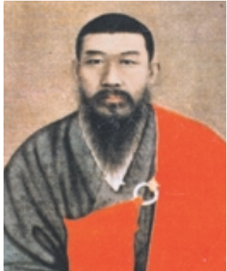
불상·경전·조사라고 하는 고정관념 훌쩍 뛰어넘어야 '평상심'의 자유로운 삶 가능