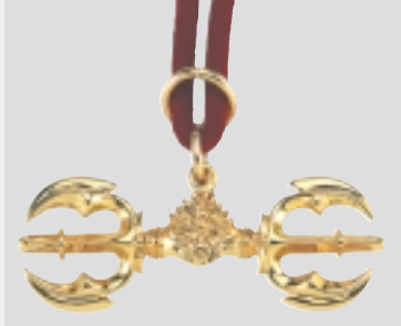
안전운행의 선물! 삼재소멸의 선물!

자동차를 타고 가다보면 운전석 위에 영주표를 고정시켜 걸고 다니는 차를 종종 보게 된다. 영주자는 부처님께 예물을 드리는 공양구로 차에 고정시키는 것은 잘못된 것이다. 부처님법구경에는 중생들이 사는동안 고통을 당하지 않도록 하는 각종 비방의 법구들이 많이 있다. 그중에서 달리는 자동차에 꼭 맞는 법구가 삼고금강저다. 칼날이 두개달린 이금강저 칼날이 양쪽에 3개씩 있는 삼고금강저, 칼날이 양쪽에 5개씩 있는 오고금강저가 있는데 각각 사용하는 뜻이 다르다. 자동차는 항상 사고의 위험을 지니고 달리므로 운행중에 닦쳐올 화를 미리쫓고, 금강의 지해로 안전운행하며, 어떠한 시련과 고통이 와도 승리하는 뜻을 지닌 삼고금강저를 자동차에 걸고 다니시면 된다. 전화로 신청하면 우체국 택배로 발송해 준다. ●삼고금강저 제작 가격38,000원 문의전화:(02)741-4477 농협:032-12-193445 이상하