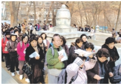
자운 스님 부도탑에서 탑돌이하는 순례단.

'서울의 진산 삼각산 남쪽 기슭, 맑은 물 여러 계곡이 루어 흐르고 한 갈래 정릉천으로 뻗어 뻗뻗한 수림과 만나 산수풍경이 좋은 곳. 이승만 대통령이 참배 후 단정하시던 보경 스님의 인격에 감화돼 참다운 승가의 모범이 이곳에 있다고 칭송한 곳. 1953년 닉슨 미국 부통령이 방한해 한국문화의 참모습이 살아 있다고 극찬한 곳.' 여기까지만 듣고는 어느 사찰일까 고개를 가우뚱 거릴 수 있다. 하지만 한국불교 계맥을 이어온 자운 스님의 원력이 부도탑에 머무는 사찰이라는 부연 설명을 듣는다면 웬만한 불자들의 입에선 곧바로 '경국사'란 답이 주저없이 나올 것이다.