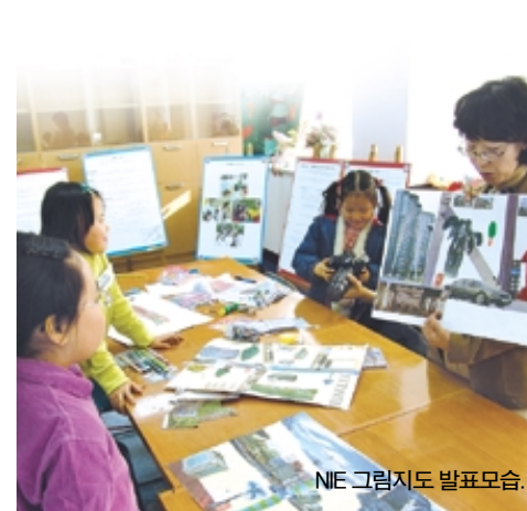
NIE 그림지도 발표모습.