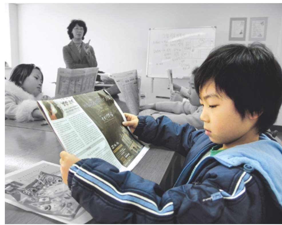
독해, 읽기, 쓰기, 논리력, 비판력 등 종합논술능력 향상에 도움이 되는 NIE. 보라매청소년수련관에서 'NIE논술특강'을 받고 있는 어린이들이 신문을 정독하고 있다.