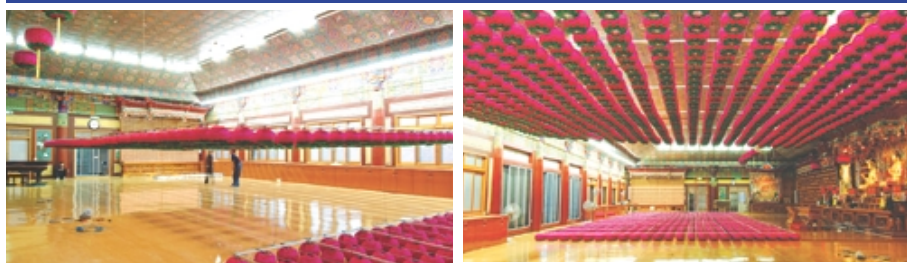
자동 승강 장치(등표 조정 작업)

전선(케이블) - 천덕연등에서 시공한 사찰 (대한불교천태종 광수사 법당)