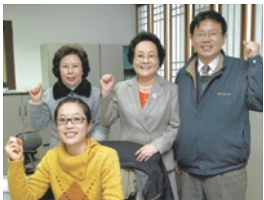
최상의 서비스를 다짐하는 민원실 종무원과 자원봉사자들.