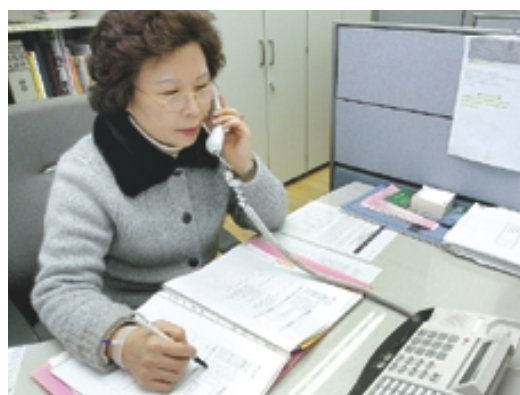
조계사 신행상담실 자원봉사자들이 종합민원실에서 민원전화 상담을 지원하고 있다.