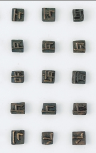
15세기 <능엄경언해>를 간행할 때 사용된 것으로 추정되는 국내 최고 의 한글 금속활자.