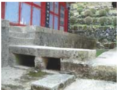
육천사 대웅전 배수구 돌다리