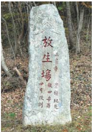
육천사 방생량 표지석