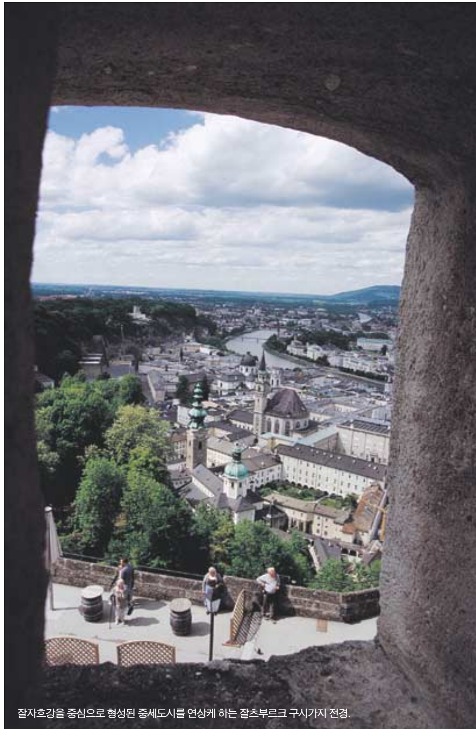
잘츠부르크를 중심으로 형성된 중세도시를 연상케 하는 잘츠부르크 구시가지 전경.

한편이 피아노의 선율을 타고 소금의 도시 잘츠부르크에 내린다. 하얀 눈을 보면 사람들은 아름다운 음악을 들을 때처럼 감상에 젖고 한다. 더군다나 천재 음악가 모차르트의 고향인 잘츠부르크에서 그의 음악을 들으며 가르동 빛을 뽐나며 도시를 산책하는 일은 어떠하겠는가? 인구 16만명의 도시 오스트리아 잘츠부르크는 250년 전에 태어난 모차르트의 흔적을 느끼기 위해 세계 전역에서 모여든 사람들로 차고 넘친다. 또 영화 <사운드 오브 뮤직>의 배경지이기도 한 잘츠부르크는 중세의 건축물들이 어찌를 나란히 맞대고 있는 예쁜 마을이다. -모차르트의 선율이 스며있는 잘츠부르크 편에서