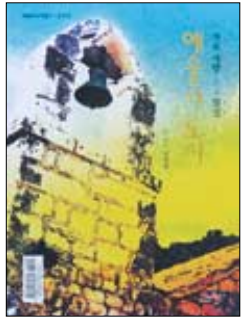
예술의 도시-자유 사랑 그리고 열정 이태훈 지음 | 다룬세상 | 1만6000원