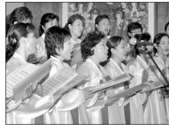
봉선사 합창단의 맑은 음성공양은 법회의 '꽃'이었다.

○...봉선사 합창단의 음성공양도 법회를 거룩하게 장엄한 영양소였다. 삼귀의와 사후서원 사가 등의