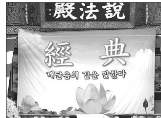
봉선사 경내와 진입로에는 다양한 현수막이 걸려 법회 분위기를 조성했다.

이로써 설법전 보수불사가 완성돼 4일 후인 25일에는 부처님을 모신 가운데 여법하게 강설대법회 회향법회가 봉행돼 환희심을 더했다. 설법전은 올 봄부터 단청과 내부 장엄불사를 진행해 강설대법회 회향에 맞춰 마무리 됐다.