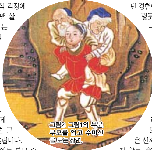
그림2·그림1의 부분, 부모를 업고 수미산을 도는 장면.

<부모은중경>에는 부모 중에서도 특히 어머니의 은덕이 강조되어 있습니다. 경전 문두에서 보았듯이, 삼계(三界)의 대 스승이고 사생(四生)의 아버지이신 더 이상 높을 것이 없는 세존을, 평바다