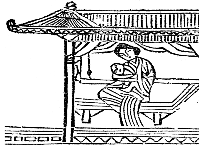
그림3·유포왕육은(劉輔黃育恩, 첫 먹여 길러주시는 은혜) 장면. 속종 13(1687)년 천보산 불암사 판본 <부모은중경>.

다음으로 경전에는 자식 무사함에 모든 고통을 잊는 은혜, 첫 먹여 길러주시는 은혜(그림3), 자식을 위해 모진 일도 감수하시는 은혜, 끝까지 버리지 않고 어여버 여기시는 은혜 등이 나열됩니다. 지난날 곱고 아름다웠던 자태가 자식 뒷바라지에 망가지고 거칠어져도 대수롭게 생각하지 않는 모정, 자식들의 괴로움은 잠시라도 참으로