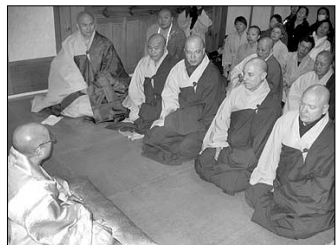
해의 한국불교 수행자 한국문화 체험이 12월 1일부터 10일까지 합천 해인사, 김천 청암사 등지에서 열렸다.

참가자들은 1일 서울 회계사에서 입재식을 시작으로 2일 한국민속촌 및 천안 독립기념관, 4일 여진미술관 등을 방문했다.