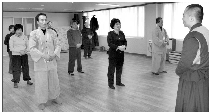
보리법문 수행을 하고 있는 불자들이 이들을 보리법문 수행이 간단하고 쉬운데다, 수행효과를 금방 느낄 수 있는 장점이 있다고 말한다.