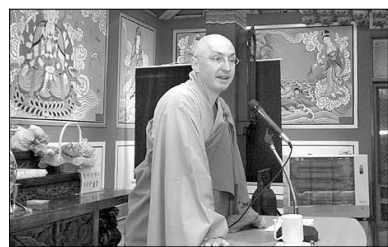
해철 대전 충북 지사장

11월 29일 충북불교대학(화정 각) 초청으로 열린 강연회(사진)에서 현각 스님은 500여 대중에 “불교는 일방통행의 가르침이 아니라 큰 의심을 갖고 대화식을 옹의심을 풀어 스스로 참나를 찾는 공부”라며 “내면 보다 밖의 모습에 치우쳐 살고 있는 스스로에게 질문을 던지고 자신을 바로 보아야 한다”고 말했다. 현각 스님은 서양의 종교와 정치, 교육의 한계를 느끼던 중 은사 승사 스님을 만