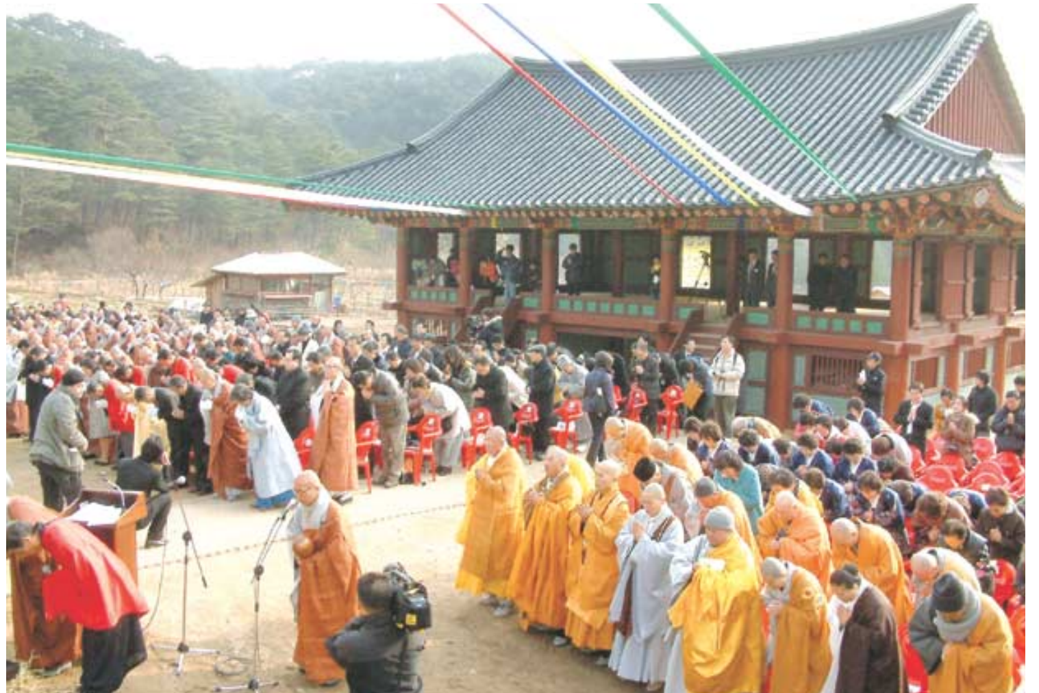
‘금강산 신계사 복원 남북공동 낙성식’이 금강산 신계사에서 11월 19일 남북한 불자 500여명이 참가한 가운데 열렸다. 극락전, 나한전 등 총 11동의 전각이 복원된 신계사는 남북화합과 평화통일의 초석이라는 새로운 의미로 금강산의 일부가 됐다.

봉행사를 통해 지관 스님은 “2004년 대웅보전 낙성에 이어 오늘 이렇게 극락전과 나한전 등을 비롯해 11동의 전각을 복원하고 낙성식을 가질 수 있었