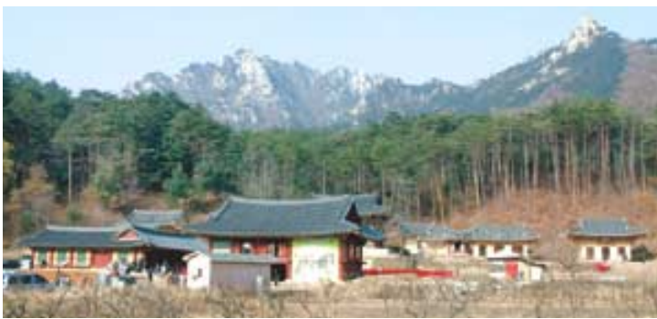
6년여의 복원봉사를 통해 옛 모습을 되찾은 금강산 신계사 전경.