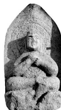
법과 형태 등이 유사한 점으로 보아 동일한 연대의 통일신라시대 말기부터 조선시대

도, 원래의 위치 등을 확인한 후 부산시립박물관에 전시·보관할 계획”이라고 밝혔다. 이번 인수는 향후 연합토지관리계획협정(LPP)에 의해 반환되는 미군기내 문화재의 관리와 보호에 대한 시발점이 된다는 점에서 의미가 크다고 할 수 있다. 일명 ‘하얏리아 캠프 불상’이라 불렸던