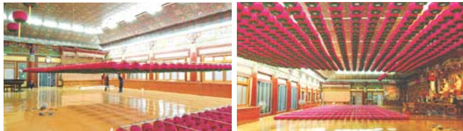
자동 승강 장치(등표 조정 작업)