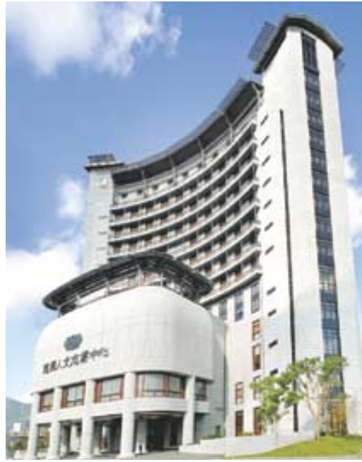
자제자선사업기금회가 설립·운영하는 타이베이시에 위치한 파이아이 TV의 본사 전경.

했다. 이 같은 편성은 정치·경제 사건을 지양하고 철저히 ‘사람 사는 모습’을 취재하려는 파이아이TV 지침에 따른 것. 실제로 파이아이TV가 자원봉사자의 미담사재를 밀착 취재해 제작한 ‘대애극장(大愛劇場)’ 프로그램은 대만 내 시청률 순위 10위 안에 들 정도로 인기가 많다. 한편 자제기금회는 ‘대만의 성모 테리사 수녀’로 불리는 정연(證嚴) 스님이 1966년 설립한 불교단체로, 전 세계 28개국 수만명이 자제위원으로 활동 중이다. 이 단체는 지진, 태풍 등 자연재해 지역의 주민들에게 현금과 구호물품을 지원해오고 있다. 회교국 인도네시아와의 인연은 자제기금회가 지난해 반다 아체(Banda Aceh)에 3700 가구를 위한 ‘파이아이 마을’ 건립과 5개 학교를 설립해준 데에서 비롯된다. 인도네시아 반다 아체지역은 지난 2004년 인도양 12개국