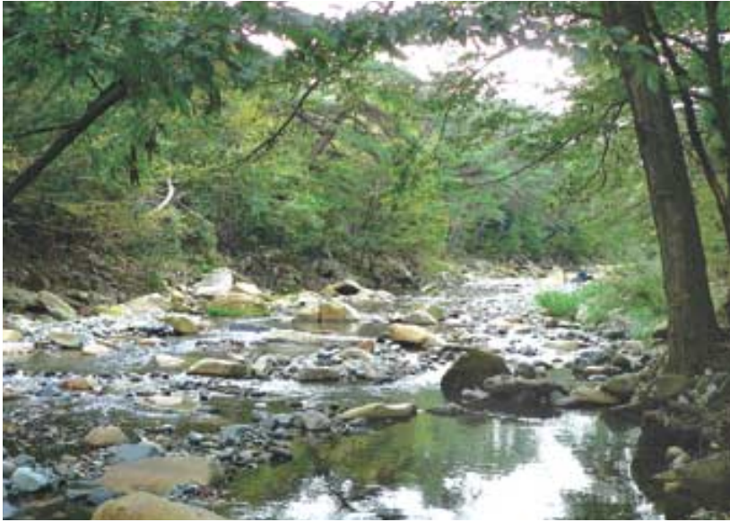
양산천의 최상류지역인 통도굴.