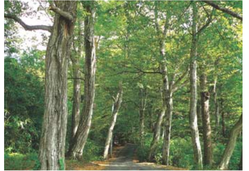
극락암과 비로암을 잇는 서어나루 숲길.

낙동강맥은 우리나라 13정맥의 하나로, 백두대간 태백의 구봉산에서 남쪽으로 뻗어 백병산-백암산-주왕산-가지산-금정산-물운대로 내려와 남해로 침잠하는 산 줄기이다. 해발 1,050m인 영취산은 그 가운데 가지산과 금정산 구간에 위치해 있다. 부처님 당시 마가다국 왕사성의 동쪽에 있던 그라드라산의 한자 지명을 빌어서 영취산(靈鷲山), 취서산(鷲棲山), 영축산 등으로 불리고 있다. 최근 양산시에서 여러 지명으로 혼선을 빚고 있다 하여 ‘영축산’으로 통일했다.