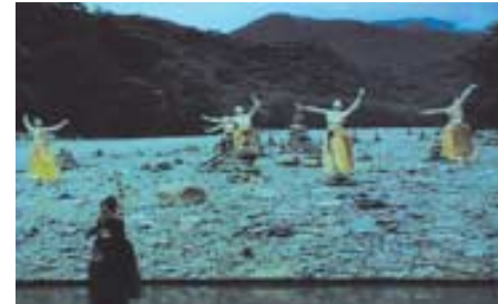
무대의 독무는 영상 속 무용수들과 어울려 환상의 군무로 변신한다.

연출과 촬영을 맡은 육정화 교수(영남외국어 대학 방송영상디자인과는 “지난 여름 시원한 솔밭을 기억하며 솔거라는 예술가의 화첩을 꺼내 보았다”며 “한 예술가의 삶을 단편적인 조각들로 표현한다는 게 조심스럽고 힘든 일이었지만 이번 작품을 통해 그의 예술적 영감을 재현해 보