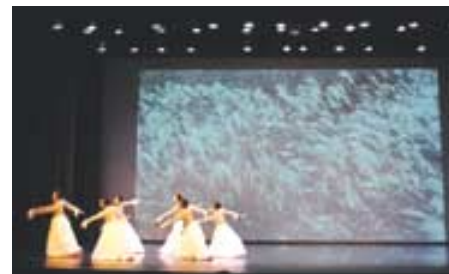
자연과 무용수를 비추는 영상은 다양한 공간을 무대위에 연출한다.