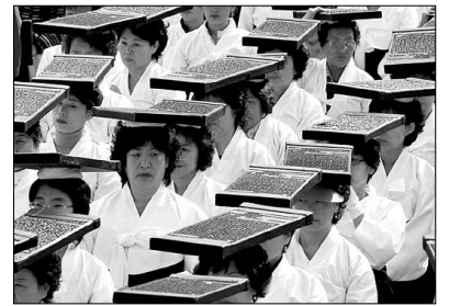
대장경판 이운 재현 모습

2006 팔만대장경축제가 10월 27일부터 30일까지 4일간 경남 합천군 가야면 일대에서 성대히 열렸다. 올해 7회째를 맞은 팔만대장경 축제는 국내 유일의 목판인쇄문화축제로 3만여 관중이 운집한 가운데 우리의 전통목판인쇄문화 한 자리에서 체험할 수 있는 다채로운 행사로 펼쳐졌다. 27일 오후 5시부터 열린 개막식에서는 화려한 축포와 함께 ‘팔만대장경’의 작곡가 김수철씨의 특별 공연이 펼쳐졌고, 29일에는 해인사 스님들과 지역 주민 600여명이 조선 초기(1398년) 강화도에 서 서울 지원사를 거쳐 해인사로 대장경이 옮겨지는 과정을 재현해 장관을 이뤘다. 가야면을 가로지르는 도로 중앙에는 국내 최정상급 판화작가 10명의 야외전시와 시각 전각 와각 작품 초청 전시회가 관람객들의 이목을 집중시켰다. 무엇보다 참가자의 인기를 끈 것은 목판인쇄문화체험여행이었다. 축제참가자들은 나무를 갈라 채취하는 과정부터 나무를 잘라 판을 다듬고 글자를 새겨 판각하는 작