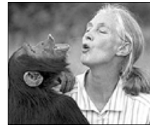
제인 구달 박사