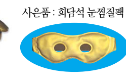
사은품: 희담석 눈찜질팩