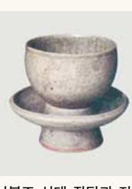
남북조 시대 전탁과 자기 찻잔

으로 이용했고, 찻잎에 쌀·생강·파·귤 등을 넣어 끓여 죽처럼 먹기도 했다. 이처럼 차가 서남지역의 소수민족을 중심으로 식용(食用)과 약용(藥用)으로 이용, 변천되어 기호식품으로 음용(飲用)될 때까지 차를 마시는 방법과 즐기는 사람의 계층은 다양했다.