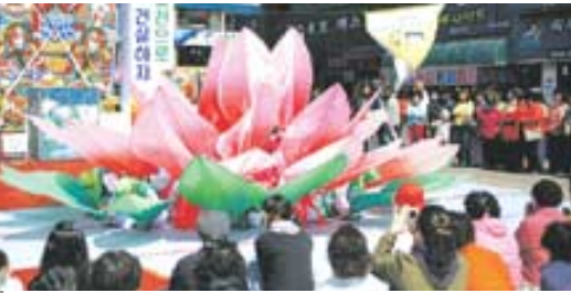
지난 4월 팔관재보존회가 인선 율미도 문화의 거리 특별 도랑에서 선보인 '연일바람' 공연.