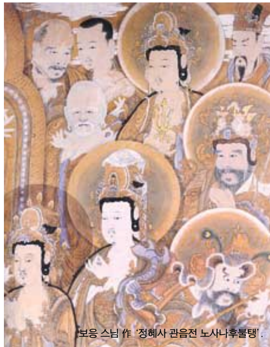
보응 스님 작 '정혜사 관음전 노사나후불탱'.

원작 <오세암>은 1983년 발간돼 스테디셀러로 자리매김한 이래 영화, 애니메이션 등으로 제작됐다. 뮤지컬로 변신한 것은 이번 작품이 처음이다. <오세암>이 한국인들의 사랑받 받은 것은 아니다. 애니메이션 '오세암'은 프랑스에서 열린 국제애니페스티발에 참가해 '대상'을 수상하는 등 국제무대에서도 그 가치를 인정받았다. 애니메이션을 재구성한 만화책 <오세암>도 그 인기를 이어갔다. (02) 2049-4700 강지연 기자