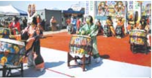
십이지신들이 신나는 난타무를 펼치는 '십이지나희'.

공연을 할 것"이라며 "연말 해돋이 법회, 인선 신년 수륙팔관재법회 등 확정된 국내 공연 외에 해외 공연도 준비 중"이라고 앞으로의 포부를 밝혔다. (02)741-0495 ■ 팔관재란 팔관재(八關齋)는 고려 때의 불교의식 팔관회이다. <삼국사기>에 의하면 팔관회의 시초는 551년 신라에서 행해진 것으로 추정된다. 고려 태조의 훈육심중 중에도 그 중요성을 지적해 성종조를 제외하고는 연등회와 함께 국가의 2대 의식 가운데 하나가 됐다.