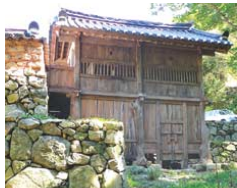
김통사 해우소 뒤편.