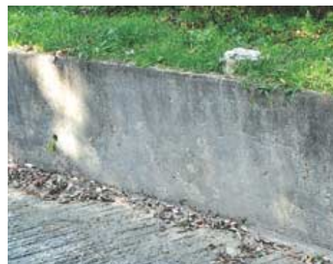
양진암 가는 길의 옹벽.

예전에는 사하촌에 서당당이나 장승이나 하는 마을 지킴이들이 많았다. 그러던 것이 알고 모르는 사이에 사라져버렸다. 용케 살아남은 것들도 제의(祭儀)가 뒤따르지 않아서 젓밥 굶은 지가 오래되었다. 그런데 비하면 운달산 김통사의 사하촌 서당당은 아직도 마을사람들에 의해 받들어지고 있어서 절골로 들어서는 느낌이 푸근하다.