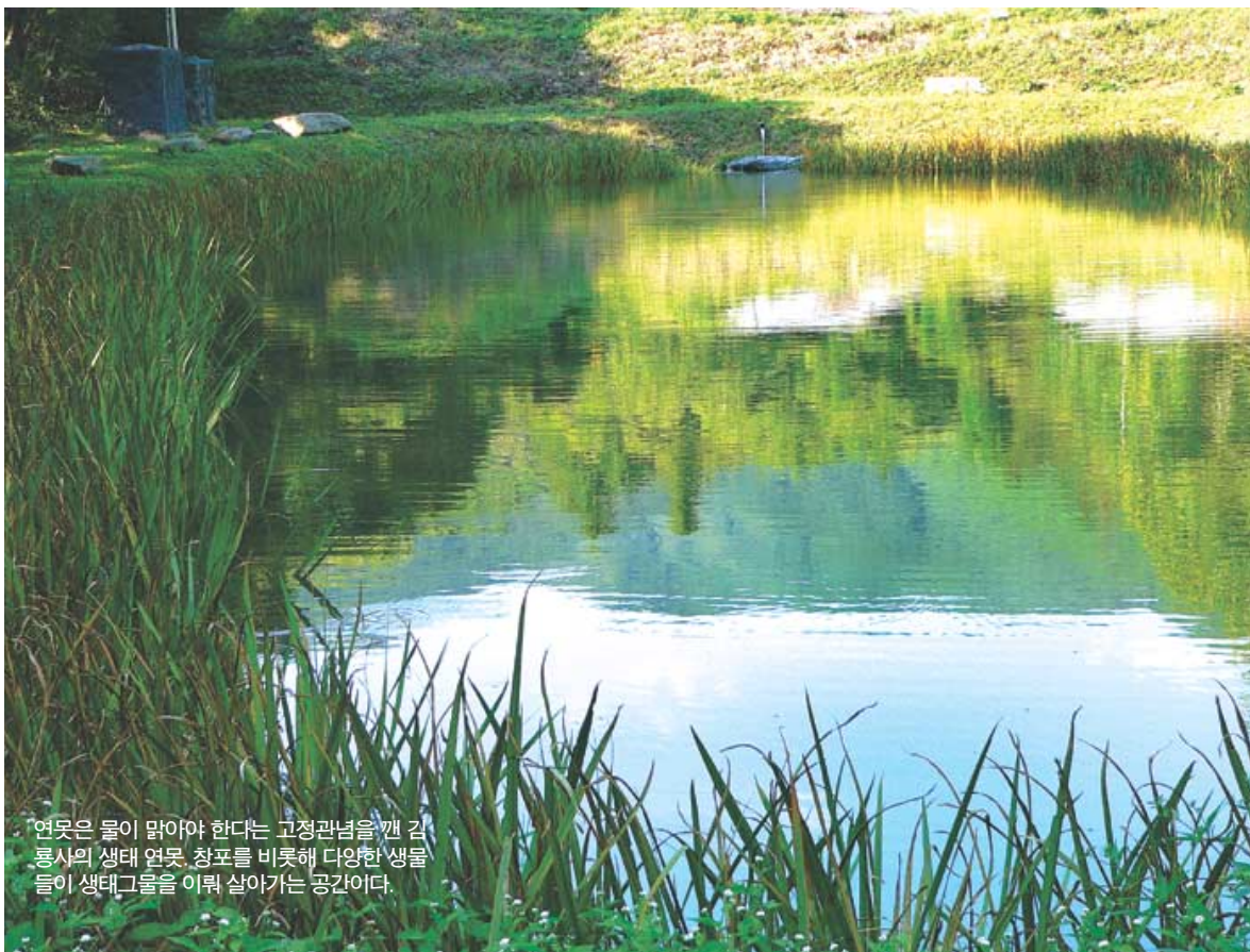
연못은 물이 맑아야 한다는 고정관념을 깨 김통사의 생태 연못. 청포를 비롯해 다양한 생물이 생태그늘을 이뤄 살아가는 공간이다.